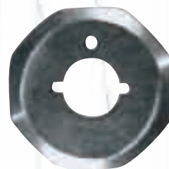
Дисков нож за Kuris / Maimin Soprena