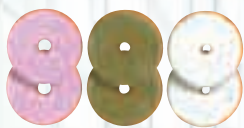
Ког: 13/2 Камъни за заточване