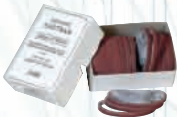
Заточващи шкурки за гатер ножица 8" и 10". 100 бр. кутия