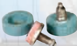
Заточващи камъни за дискова ножица