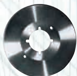
Дисков нож за Kuris