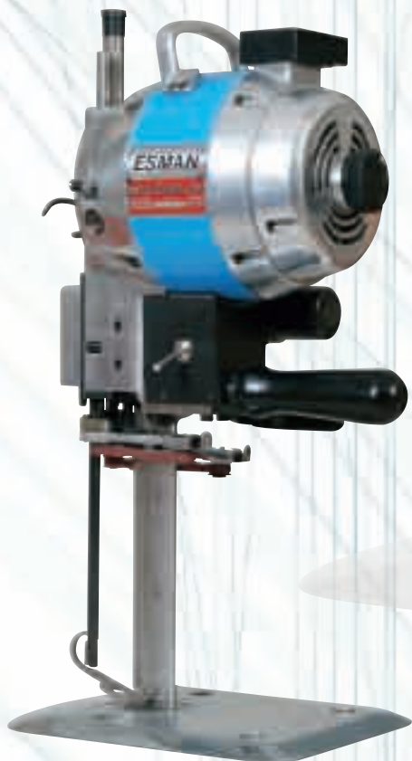
Гатер ножица 6", 8"