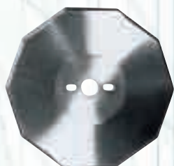
Дисков нож за Bullmer