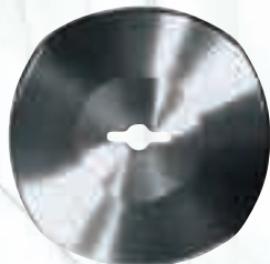
Дисков нож за Hoogs