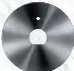
Дисков нож за Rasor