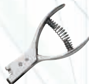
Клещи за поставяне на центри

Всички дискови ножове са производство на немската фирма MAIER