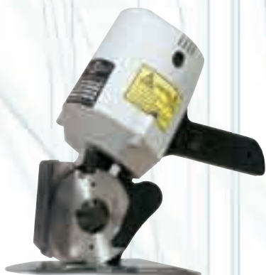
Дискова ножица за настил до 80 мм.