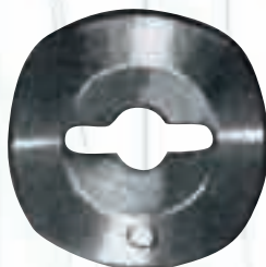
Дисков нож за Hoogs