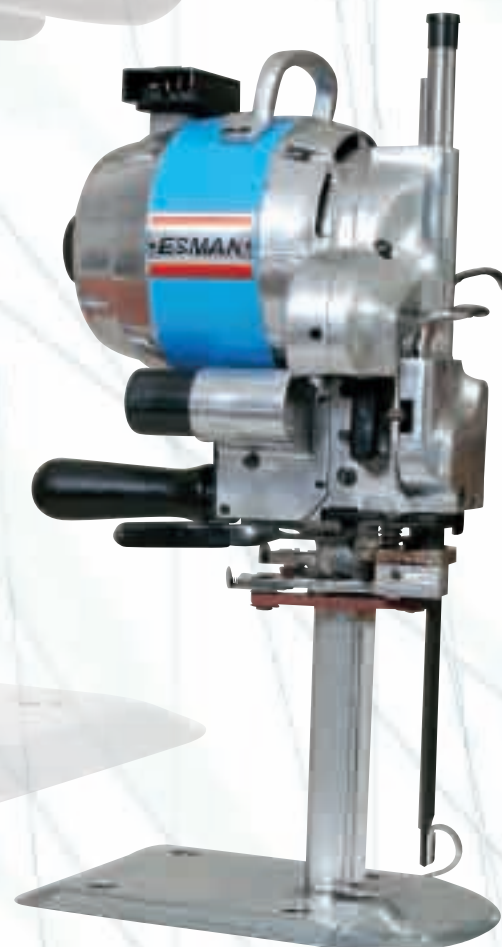
Гатер ножица 10"