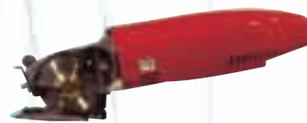
Дискова ножица за настил до 20 мм.