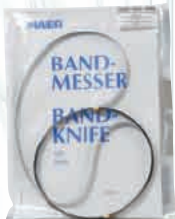
Лента за банцинг