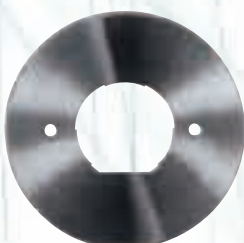
Дисков нож за Eastman