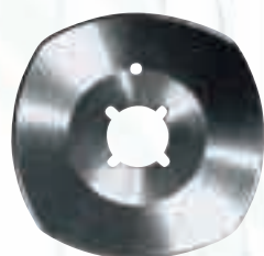
Дисков нож за Kuris / Soprena