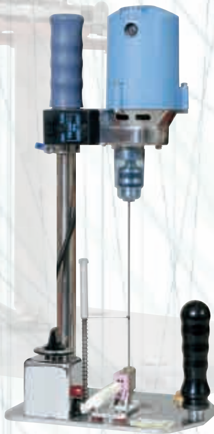
Маркировъчно шило с термоугла. Максимален пробив 20 см.