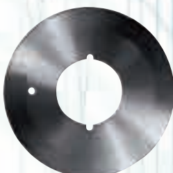
Дисков нож за Wolf