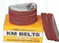
Заточващи шкурки за гатер ножица 5" и 6". 50 бр. кутия