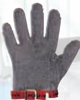
Предпазна метална ръкавица за лява и дясна ръка